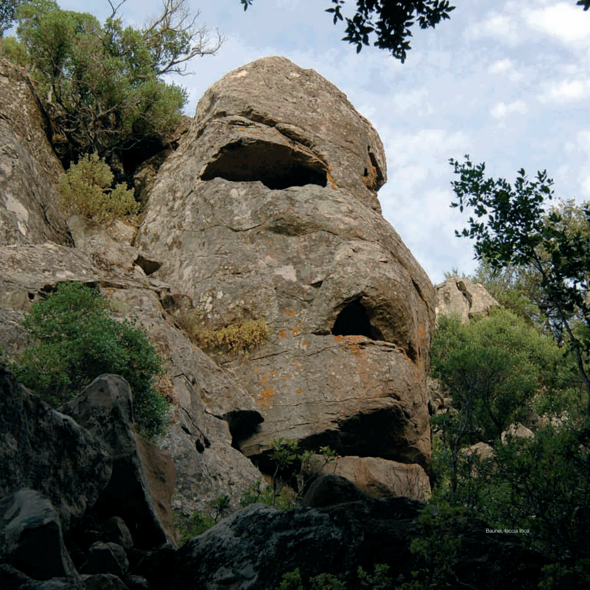
Baunei, faccia litica