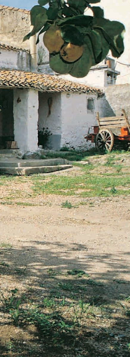
Lotzori, Domu de Tizi Nazia

L'art et la tradition artisanale de l'Oglastra sont accessibles à ceux qui veulent les redécouvrir. Sur tout le territoire, de vieilles maisons abritent de petits musées d'ethnographie qui racontent aux visiteurs la vie et les anciens métiers locaux.