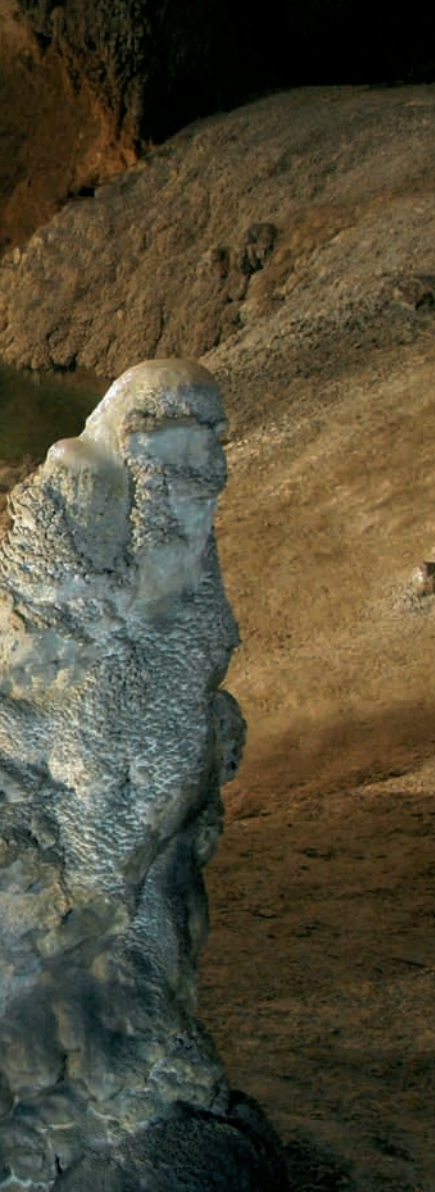
Baunei, Grotta dell'Fico

La nature réserve elle aussi de grandes surprises. Parmi les montagnes ou dans les falaises à pic sur la mer, des grottes cachent les trésors de la naissance des montagnes. Pour faciliter leur visite, des parcours touristiques permettent d'admirer la beauté étonnante des profondeurs de la terre. Les plus passionnés peuvent visiter, sous la conduite de guides, des branches spéléologiques intactes et découvrir le charme d'une excursion dans les profondeurs.