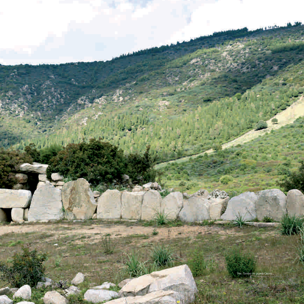
Triei, Tombe dei giganti Osona