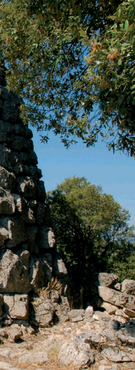
Olenti, Nuraghe Uxenti

[ Tels des gardiens attentifs d'une civilisation disparue, les nuraghes fascinent par leur impassibilité devant le passage du temps. Ces tours circulaires, à la fois simples et géniales, faites de grands blocs de calcaire ou de granite, virent le jour dans des temps immémoriaux pour dominer des paysages âpres et immenses. Ils sont aujourd'hui les témoins d'une histoire mystérieuse qui confine au mythe.